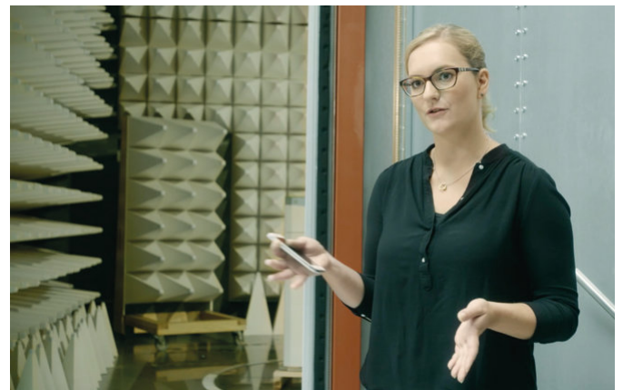
En los tests se simulan intensivamente todas las posibles aplicaciones