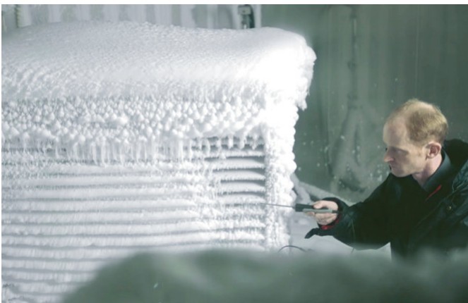
En la sala climática se analizan las unidades exteriores ante condiciones climatológicas extremas