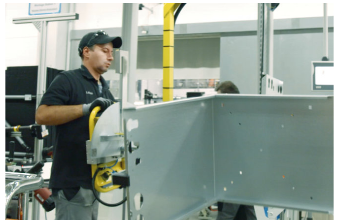
Las bombas de calor son producidas por un equipo altamente cualificado