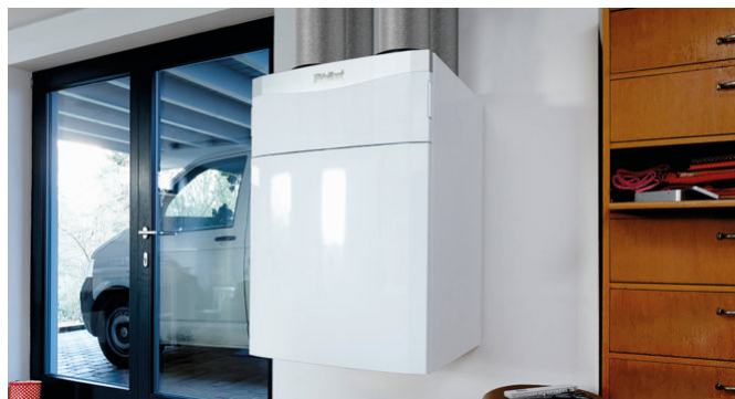
recoVAIR, ventilación doméstica con recuperación de calor