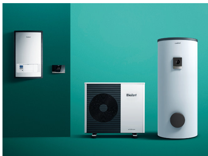
aroTHERM split bomba de calor aire-agua, módulo hidráulico montado en la pared, control multiMATIC, uniSTOR depósito para ACS

aroTHERM split es una bomba de calor que ofrece ahorro de energía y confort para su vivienda. Cómo energía gratuita utiliza el calor del aire. El sistema aroTHERM split está compuesto por 2 componentes: la bomba de calor situada en el exterior y una unidad interior.