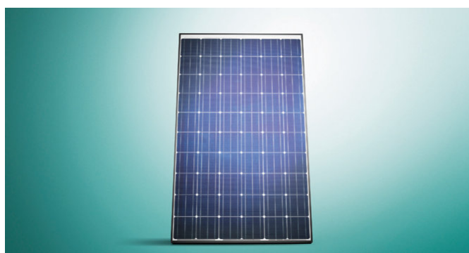
auroPOWER, sistema fotovoltaico