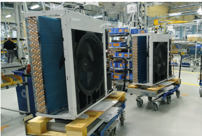
Cada unidad se verifica antes de salir de fábrica