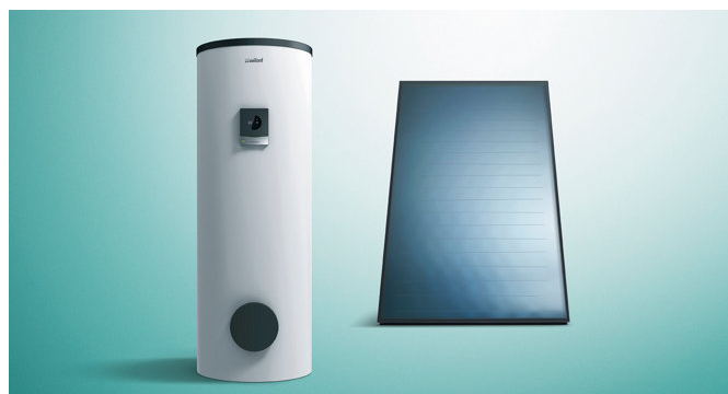
auroSTOR depósito solar, auroTHERM panel solar