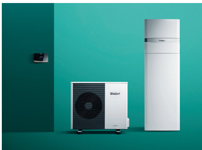
aroTHERM split bomba de calor aire-agua, uniTOWER torre hidráulica